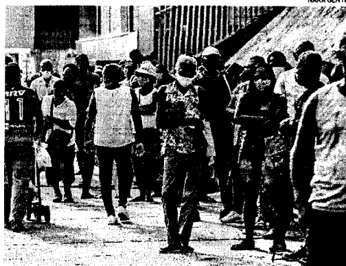
Fila no 5º Centro, nos Barris, chegou ao bairro do Garça

Em Salvador, 3,5 mil pessoas que deveriam ter tomado a segunda dose ainda não buscaram os postos. Outras 89.624 completaram o esquema vacinal.